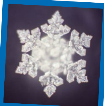
Mikrofotografierter Wasserkrystall vom Weiher Cristallo d'acqua microfotografato del laghetto

In quanto gestori della struttura, rispettosi della natura, ci impegnamo a mantenere in ottimo stato, giorno dopo giorno, questo gioiello naturale e per questo motivo rinunciamo a qualsiasi uso di sostanze chimiche. Proteggiamo il sensibile equilibrio ecologico del biotopo soltanto con preparati naturali: questo lo si integra, se occorre, attraverso microrganismi efficaci come il Greengold, i minerali, i cristalli (quarzo rosa, cristallo di rocca, ametista), gli zeoliti e molti altri agenti. Vieni e prova quest'acqua gradevole e speciale.